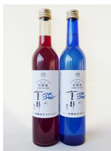
天橋立ワイン 「2012京都の赤・白(海の京都ラベル)」