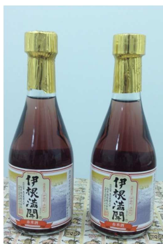
向井酒造 「伊根満開」