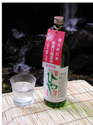
ハクレイ酒造 「夏原酒ひや」

をご提供いたします。京都府丹後地区の魅力あふれる多様な銘酒を、ぜひ、ご賞味ください。 (ご用意数終了次第、ご提供終了)