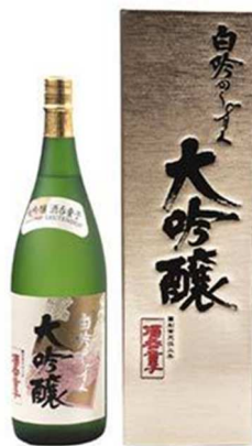
ハクレイ酒造 「白吟のしずく」