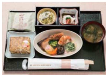
機内食夕食(イメージ)