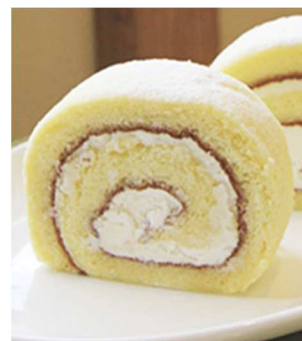
蔵Sweets HAKUREISHA 「白嶺ロール」