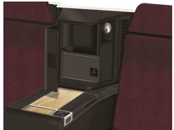
専用収納スペースの扉は、Divider としてもご利用いただけます。