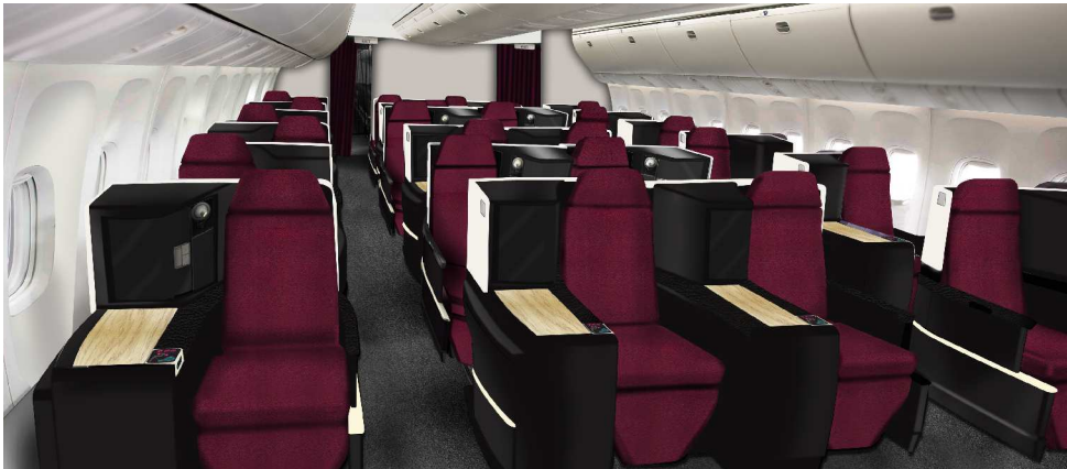
1-2-1 配列で全席から通路アクセスが可能です