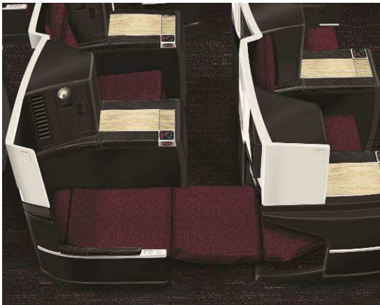
180° 水平になるフルフラットシート