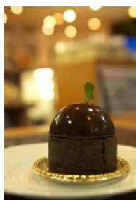
さっぽろ黒豆タルト (イメージ)

「有限会社ペシエ・ミニヨン」の焼き菓子“Cigare(シガール)”をご提供します。