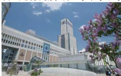
JRタワーホテル日航札幌

(*)17:00以降の出発便対象。7月上旬・中旬・下旬の3つのメニューをご用意。