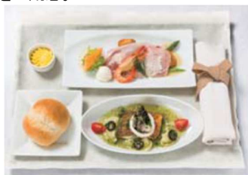
機内食夕食(イメージ)