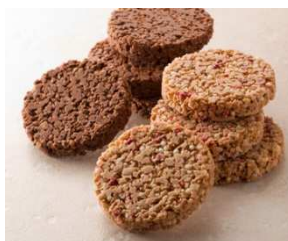
ルタオ プレミア まあある (イメージ)