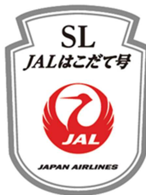
JALオリジナルヘッドマーク