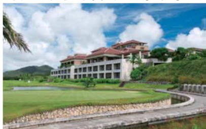
ザ・リッツ・カールトン沖縄

(*)17:00以降の出発便対象。8月上旬・中旬・下旬の3つのメニューをご用意。