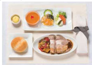
機内食 夕食 (イメージ)