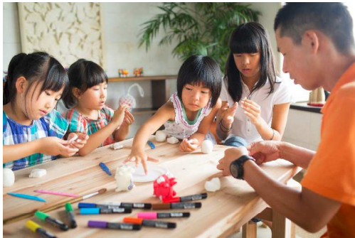
手作りシーサー／図工