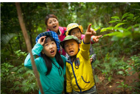
西表島秘境のんびりクルーズ／生活