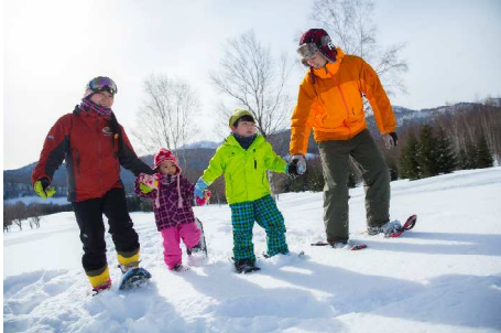
スノーシュー／生活