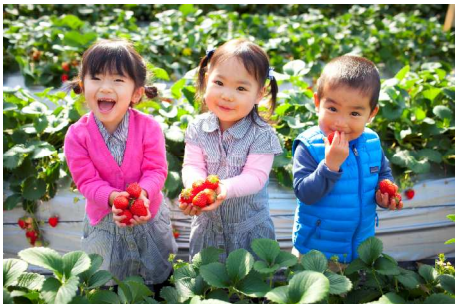
旬の味覚を楽しむいちご狩り／遠足