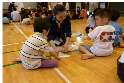
折り紙ヒコーキ教室

「日本旅プロジェクト」の具体的な企画内容は、WEBサイト「JAL 旅プラスなび」や機内誌「SKYWARD」を通じて発信してまいります。詳細は http://www.jal.co.jp/tabi/special/tabi_project/index.html をご覧ください。