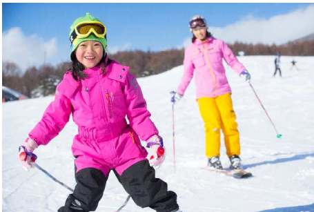
晴天率85%のゲレンデでスキー体験／体育