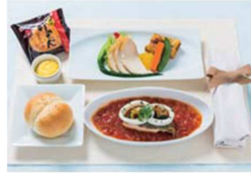
機内食 夕食 (イメージ)