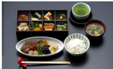
「福岡御膳」(イメージ)

(*)日本発/バンクーバー/モスクワ/シドニー/シンガポール/クアラルンプール/ジャカルタ/デリー/ハノイ/ホーチミンシティ/バンコク/マニラ/香港/中国/台湾/グアム路線(羽田深夜発便を除く)。路線により、ご提供内容が異なります。