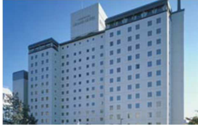
西鉄グランドホテル

(*)17:00以降の出発便対象。12月上旬・中旬・下旬の3つのメニューをご用意。