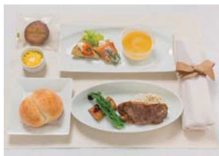
機内食 夕食 (イメージ)