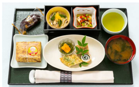
機内食 夕食 (イメージ)