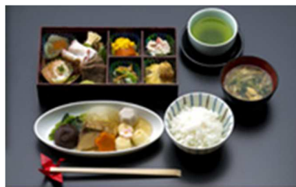
「東北御膳」(イメージ)

(*)日本発/バンクーバー/モスクワ/シドニー/グアム/シンガポール/クアラルンプール/ジャカルタ/デリー/マニラ/ハノイ/ホーチミンシティ/バンコク/中国/香港/台湾路線(羽田深夜発便を除く)。路線により、ご提供内容が異なります。