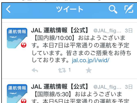
[通常時の発信イメージ]