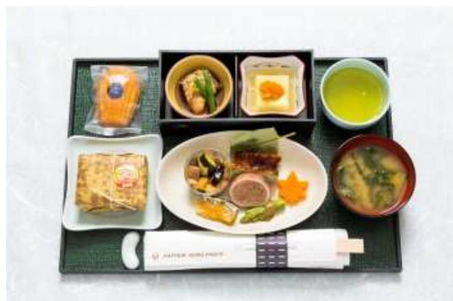
機内食夕食 上旬(8月1日~10日)(イメージ)