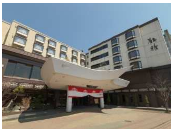
あかん遊久の里鶴雅

(*)17:00以降の出発便対象。8月上旬・中旬・下旬の3つのメニューをご用意。