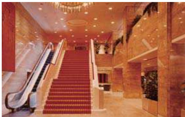
ホテル イタリア軒のロビー