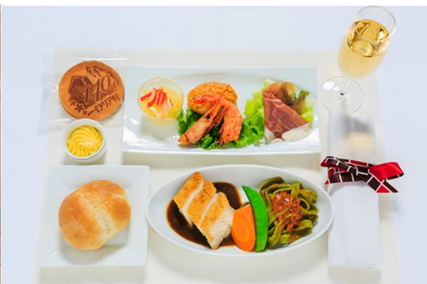
機内食夕食 上旬(9月1日~10日)