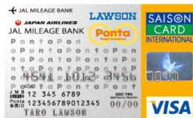
JMB ローソン Ponta カード Visa