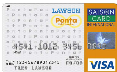
ローソン Ponta カード Visa

ローソン、クレディセゾン、JALの3社は、コンビニエンスストアにおけるクレジットカード利用および各種ポイントが普及する中、より便利でおトクなクレジットカード・ポイントサービスを提供すべく、引続き新しい企画に取り組んでまいります。