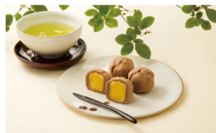
おとし文(イメージ)

(*)4月7日頃より日替わりでご提供します。ご用意数がなくなり次第終了させていただきます。