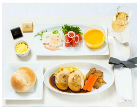
機内食 夕食 (イメージ)