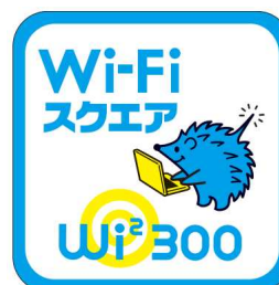
図2 Wi2 300 エリアサイン

利用方法および利用可能エリアは「Wi2 300」 サイト( http://wi2.co.jp/jp/300/ )をご覧ください。