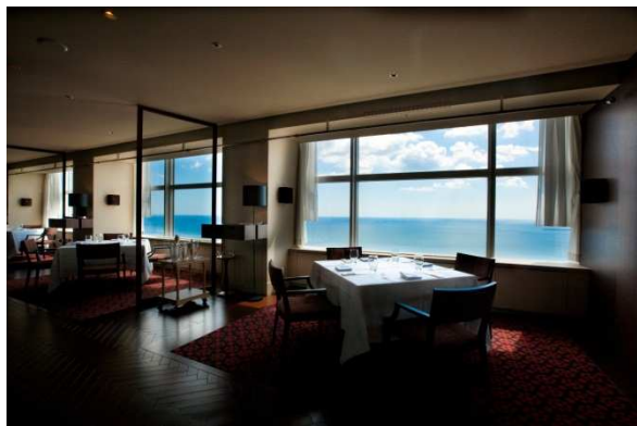
タツヤカワゴエ・ミヤザキ(店内イメージ)