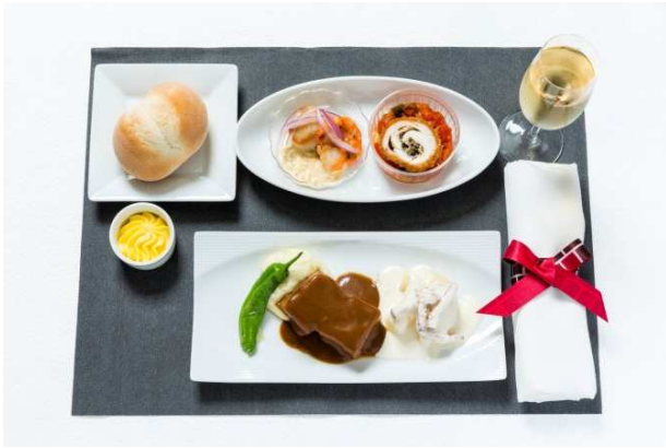
機内食イメージ(下旬)