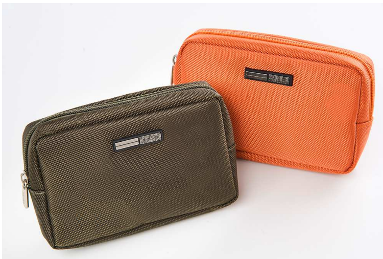
ダークグリーン オレンジ