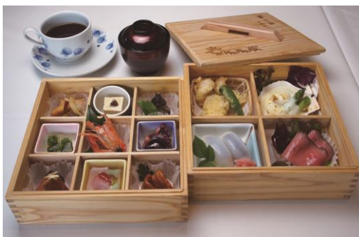
(*食事イメージ画像)

URL: http://www.jal.co.jp/domtour/ssy/iyonadamonogatari/