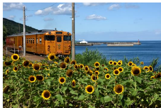
(観光列車イメージ画像)