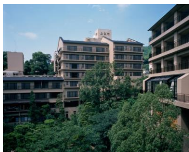
ふなや外観(イメージ)

(※1) 17:00以降の出発便対象。沖縄便は、18:00以降の到着便で夕食をご提供。上旬・中旬・下旬の3つのメニューをご用意。