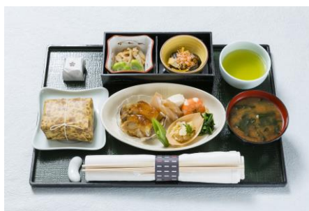
機内食イメージ(上旬)