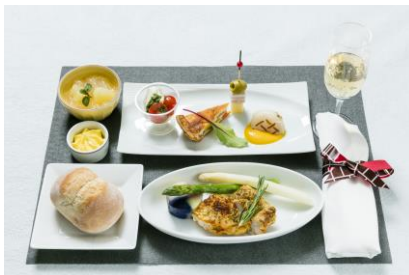
上旬の機内食イメージ