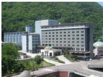
「祝いの宿 登別グランドホテル」(イメージ)

(※1) 17:00以降の出発便対象。沖縄便は、18:00以降の到着便で夕食をご提供。上旬・中旬・下旬の3つのメニューをご用意。