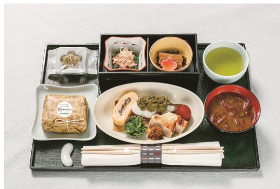
機内食イメージ(上旬)