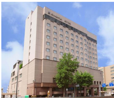
「ホテルメトロポリタン盛岡」外観イメージ

(※1) 17:00以降の出発便対象。沖縄便は、18:00以降の到着便で夕食をご提供。上旬・中旬・下旬の3つのメニューをご用意。