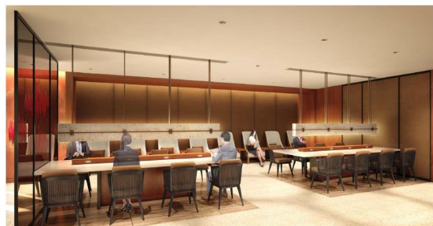
(ダイニングエリア・イメージ)