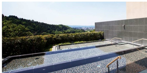
御宿 東鳳 棚雲(たなくも)の湯