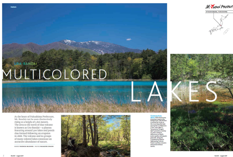
(国際線機内誌 英文特集記事イメージ)