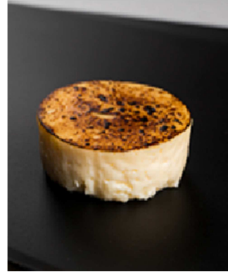
「御献上チーズケーキ」

JALショッピング通信販売のグルメ・ファーストクラス秋号にて販売決定(8/22発行予定)