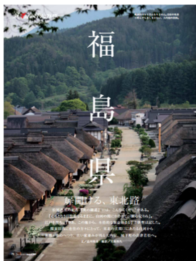
(機内誌特集記事イメージ)

国際線・国内線の機内誌「SKYWARD」では、「扉開ける、東北路」と題して、白河を皮切りに、名勝・塔のへつり、古い家並みが残る大内宿(おおうちじゅく)、城下町の会津若松へと、その魅力を紹介します。国際線機内誌「SKYWARD」でも、8月は福島県裏磐梯の大自然の美しさを英語記事で紹介します。