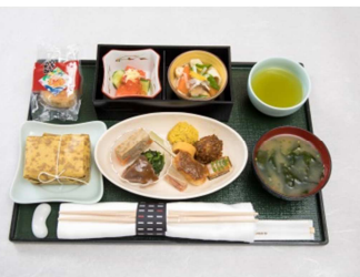
機内食上旬(イメージ)