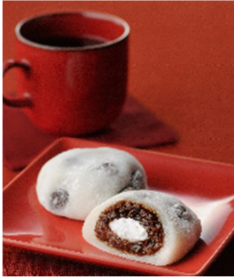
「仙臺杜の香り本舗 塩珈琲豆大福」

昼食時間帯(*3)に東北の銘菓を提供します。羽田発便では、服部コーヒーフーズ(宮城県)の「仙臺(せんだい)杜の香り本舗 塩珈琲豆大福」、羽田着便では御献上カスティーラ(秋田県)の「御献上チーズケーキ」を提供します。(*3) 昼食時間帯10:30~16:59