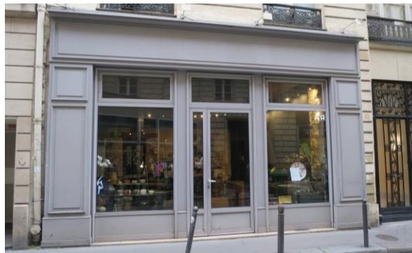
Workshop ISSE 内アンテナショップ