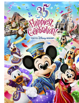
東京ディズニーリゾート 35周年 “Happiest Celebration!”

1983年4月15日に東京ディズニーランドが開園して以来、東京ディズニーシー®や4つのディズニーホテルなどの施設をオープンし、“夢がかなう場所”東京ディズニーリゾートとして進化を続けてきました。そして今年迎えた35周年のテーマは、“Happiest Celebration!”。35周年ならではの“Happiest”な体験ができるプログラムをたくさんご用意し、ディズニーの仲間たちやゲスト、キャストの笑顔がはじける特別な1年をお届けします。夢と魔法にあふれた東京ディズニーリゾートの史上最大の祭典“Happiest Celebration!”をどうぞお楽しみください。