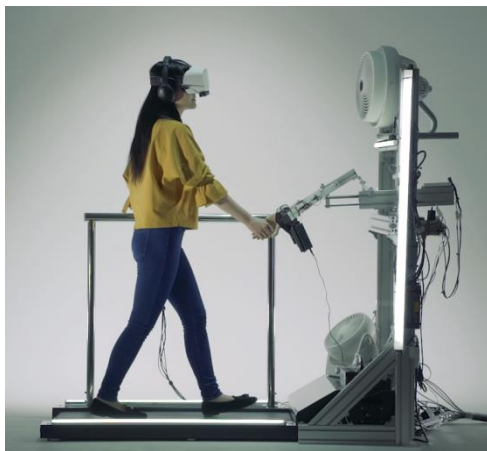
旅を気軽に試着する 「JAL xR Traveler」

http://press.jal.co.jp/ja/release/201809/004874.html