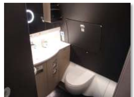
機内インテリアイメージ