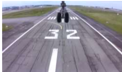
機外カメラ映像(左から、機体上方・機体前方)