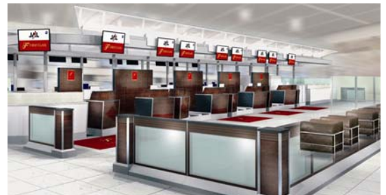
ファーストクラスカウンター（イメージ）

木目調の落ち着いた雰囲気のカウンターにてお客さまをお迎えし、スムーズな搭乗手続きをお約束いたします。新カウンターはターミナル3階中央部に位置し、ファストセキュリティレーンへの移動もスムーズです。