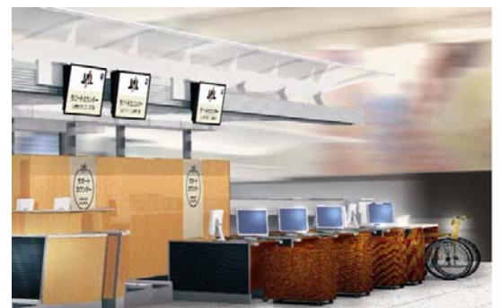
サポートカウンター（イメージ）

「JALプライオリティ・ゲストサポート」、「JALファミリーサービス」をご利用のお客さまや、赤ちゃん連れ、妊婦のお客さま向けに「サポートカウンター」を新設いたします。ユニバーサルデザインに配慮した高さの低いカウンターと椅子をご用意し、サービス介助士または社内にてサポート訓練を受けた係員がお客さまに安心してご搭乗手続きいただけるようお手伝いいたします。また空港内でご利用いただけるベビーカーや車椅子の貸し出しもいたします。