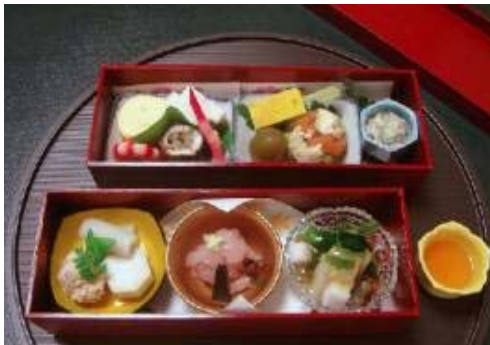
◇機内食 (ファーストクラス和食料理 かさね前菜)