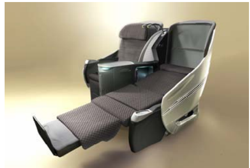
◇JALシェルフラット ネオ