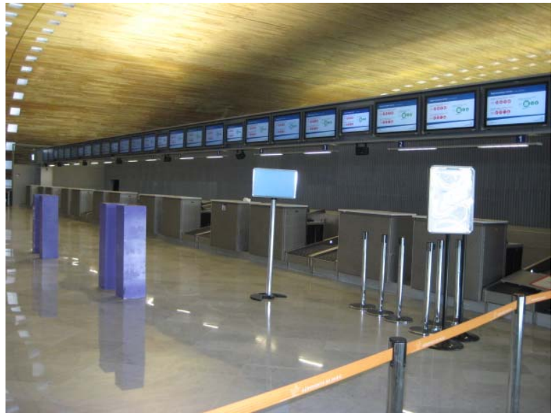
新チェックインカウンター