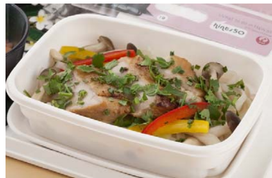
フリフリチキンとライスヌードルスープ