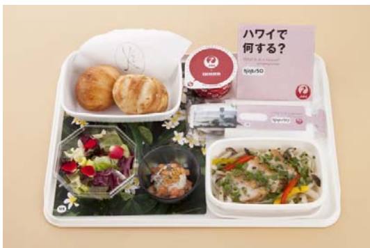
“わくわくりゾートプレート(ディナー)”

ハワイの現地料理ロコフードを採用します。7月からの夏メニューは「フリフリチキンとライスヌードルスープ」です。テリヤキ風のソースに漬け込んだチキンを炭火の上で回しながら、じっくり焼くバーベキュー・チキン「フリフリチキン(『フリフリ』はハワイ語で『回す』という意)」と、ハワイで人気のロコフード フォー(アジアン・ライスヌードル)を融合させたJALオリジナルメニューです。別添えでご用意しているパクチー(コリアンダー)でお召し上がりいただければ、まさに本場ハワイの味が先取りでお楽しみいただけます。