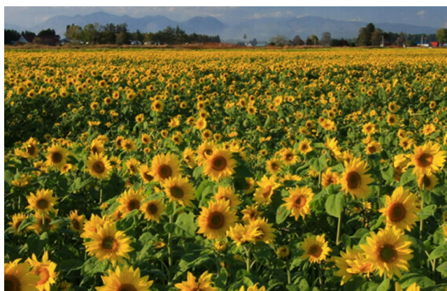
帯広 音更(おとふけ)町のひまわり畑

名古屋(中部)から帯広・釧路へ直行便で行けるこの機会に、ベストシーズンの道東エリアへ、ぜひJALの翼でお出かけください。