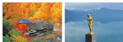
6 乳頭温泉郷(秋田県仙北市) 7 田沢湖(秋田県仙北市)