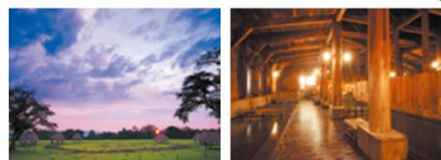
4 世界遺産 大湯環状列石(秋田県鹿角市) 5 玉川温泉(秋田県仙北市)