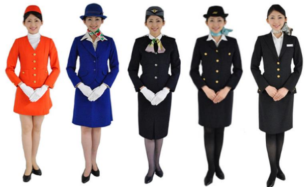
歴代の客室乗務員の制服