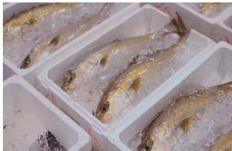
延岡魚市場の様子、真鯛とカンパチ