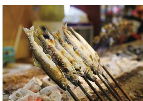
伝統漁法「鮎やな」と「鮎の塩焼き」