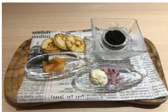
* 提供イメージ写真