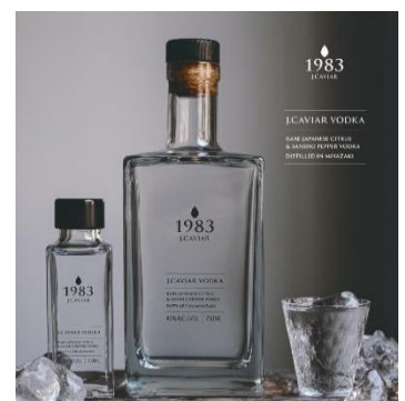
「J CAVIAR VODKA」