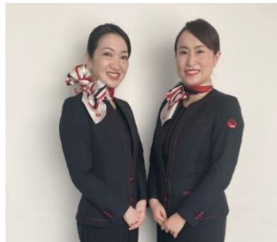
JALふるさと応援隊(イメージ)

イベント期間中は、絵馬とおみくじが一緒に楽しめる企画「えまみくじ」が島根県外で初めて設置されます。お書きいただいた絵馬は、後日、神在月で出雲地方に集まった神々が最後に立ち寄る神社「万九千神社」へ奉納しお焚き上げが行われます。