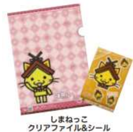
しまねっこ クリアファイル&シール