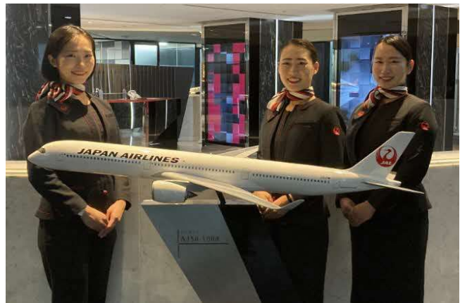
JALふるさと応援隊(イメージ)

島根県のアンテナショップ「日比谷しまね館」が、イベント期間中の3日間限定でクイーンズスクエア横浜に出店し、島根県の海産物、お菓子、地酒をはじめとした商品の販売のほか、島根県がおすすめする4店舗も同時出店します。また、「しまねご当地ガチャ」や「島根県クイズラリー」などのイベントも実施し、JALふるさと応援隊は八重垣神社の「鏡の池占い」疑似体験イベントにてご来場される方々をおもてなしします。皆さまのお越しをお待ちしております。