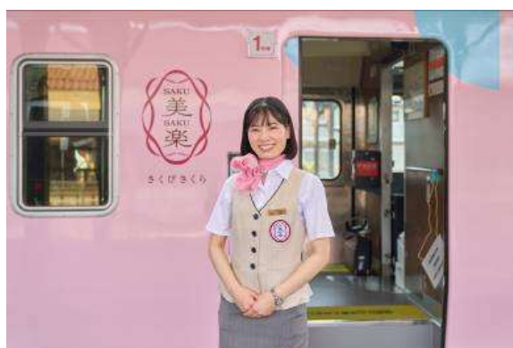
SAKU 美 SAKU 楽アテンダント