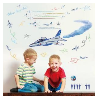
ブルーインパルスグッズ