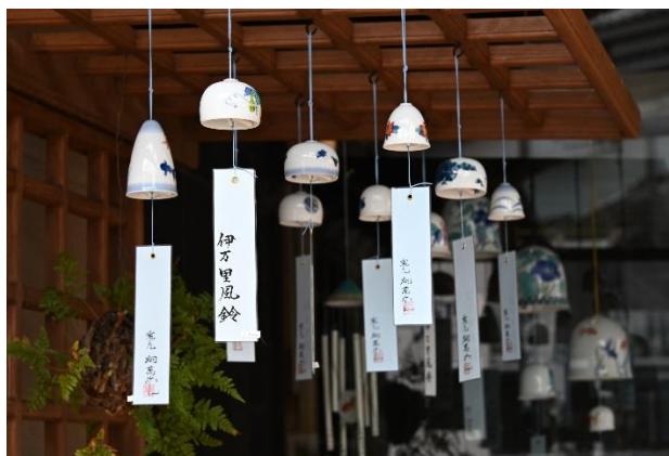
伊万里鍋島焼風鈴イメージ

JALは、これからもお客さまに選ばれ愛される航空会社をめざし、親しみのあるサービスを提供してまいります。