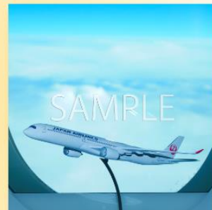
(A350-1000 就航記念デジタルアイテムサンプル)