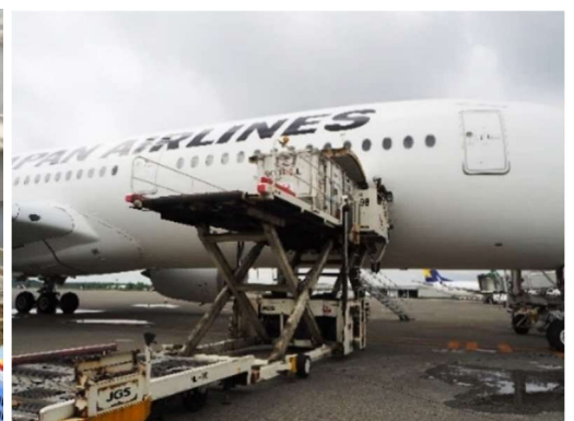
新鮮な野菜を空輸(イメージ)