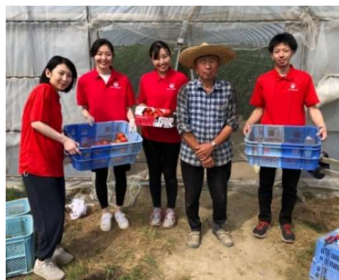
JALグループ社員も収穫作業に参加