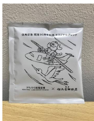
開港30周年記念インスタントコーヒー