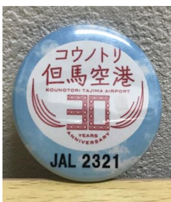
開港30周年記念ロゴ缶バッジ