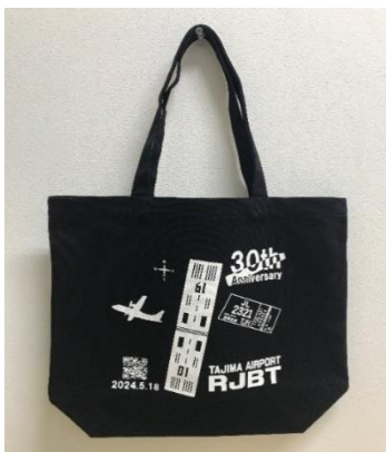
開港30周年記念トートバッグ