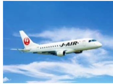
エンブラエル170型機