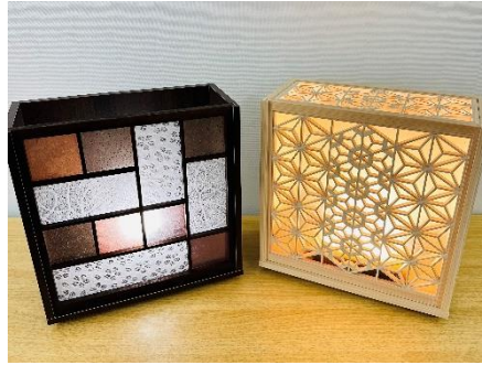
彩り障子と桜組子