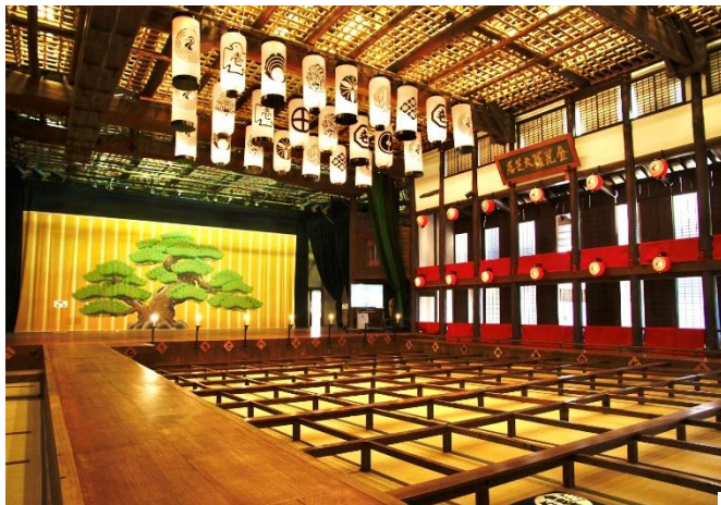
「旧金毘羅大芝居(通称:金丸座)」の客席の様子