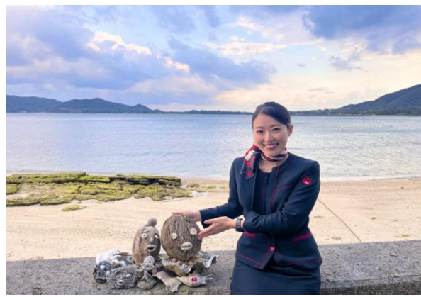
奄美大島に移住し活動をする JAL ふるさとアンバサダー