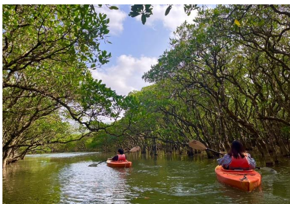
世界自然遺産の島・奄美大島の景色

このツアーは、世界自然遺産に登録された奄美大島で、現地在住の客室乗務員「JAL ふるさとアンバサダー」や現場のプロフェッショナルが、普段立ち入ることのできない奄美空港の裏側見学を通じて JAL グループの SDGs の取り組みをご紹介しますほか、島民・JAL グループ社員と共に行うビーチクリーン活動、美しい自然や伝統文化が残る島内観光を通じて、SDGs の重要性を身近に体験して・感じて・考えるサステナブルな旅です。