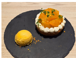
鹿児島県出水市産 大将季のタルト