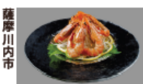
薩摩川内市 タカエビの紹興酒漬け