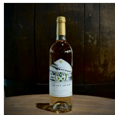
薩摩川内市「朝陽ワイナリー」のワインも提供します