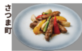
さつま町 さつま福永牛ロース の黒胡椒炒め