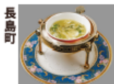
長島町 フカヒレと生あおさ の卵白スープ