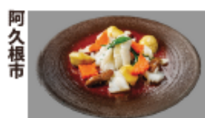
阿久根市 アオリイカと旬野菜 の塩味炒め