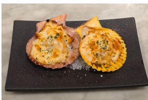
鹿児島県長島町産 ヒオウギ貝のグラチネ