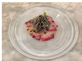
鹿児島県阿久根市産 朝穫れ魚のカルパッチョ