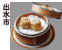
出水市 純粋さくら黒豚の焼売