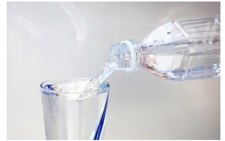
「飲む温泉水(イメージ)」

JALは、今後も垂水市と連携し、さまざまな取り組みを通じて地域社会に貢献し、持続可能な社会の実現を目指します。