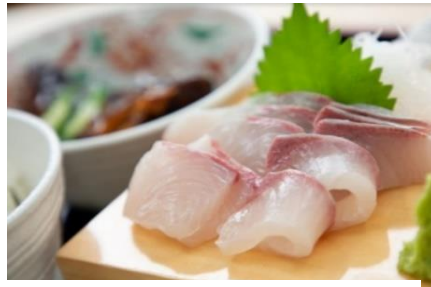
「垂水産カンパチ 海の桜勘」