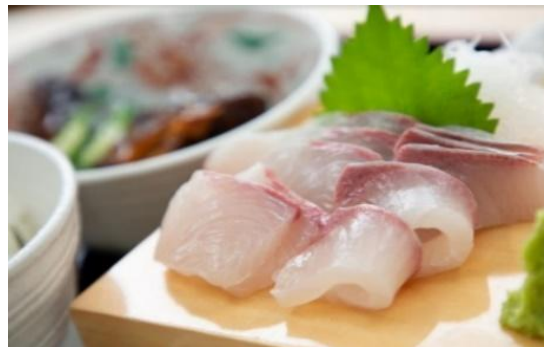
「垂水産カンパチ 海の桜勘」

JALは、今後も垂水市と連携し、さまざまな取り組みを通じて地域社会に貢献し、持続可能な社会の実現を目指します。