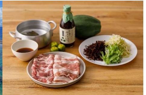
「旅する食卓BOX」盛り付けイメージ