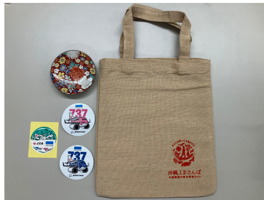
搭乗記念品 ※内容は変更になる場合がございます。